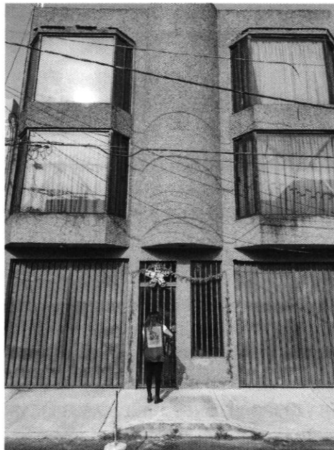
Figura 1. Vista del sitio referido en el escrito de denuncia.

En este sentido, de las constancias que obran en el presente expediente, se desprende que personal de esta Procuraduría llevó a cabo una visita de reconocimiento de hechos, de acuerdo a lo establecido en el artículo 15 BIS 4 fracción IV de la Ley Orgánica de esta Entidad, diligencia durante la cual desde el espacio público no se constató la existencia de algún ejemplar canino, sin embargo, no fue posible ingresar al domicilio en cuestión, toda vez que no había una persona que permitiera el acceso al mismo. No obstante se notificó citatorio mediante instructivo PAOT-05-300/200-11526-2021, lo anterior con la finalidad de que la persona propietaria del ejemplar canino se comunique con personal de esta entidad.