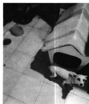
Figuras 3, 4, 5 y 6. Evidencia de sitio de alojamiento del ejemplar canino, recipientes de agua y comida, así como la cartilla de vacunación actualizada.

Medellín 202, piso 4, colonia Roma Sur Alcaldía Cuauhtémoc, C.P. 06000, Ciudad de México Tel. 5265 0780 ext 12011 Y 12400