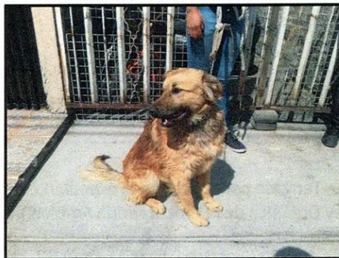
Figura 1 y 2. Ejemplares denunciados.

Es de resaltar que, en el Acuerdo de Admisión, que fue enviado por correo electrónico a la persona denunciante, se le hizo de conocimiento que contaba con un término de seis días hábiles para aportar las pruebas que estimara pertinentes en la investigación de los hechos, lo anterior conforme al artículo 90 del Reglamento de la Ley Orgánica de la Procuraduría Ambiental y del Ordenamiento Territorial de la Ciudad de México; sin embargo durante el procedimiento de investigación, no fueron proporcionados elementos de prueba que pudieran determinar incumplimiento a la normatividad en materia de bienestar animal.