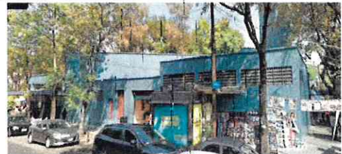
Av. Vicente Suárez