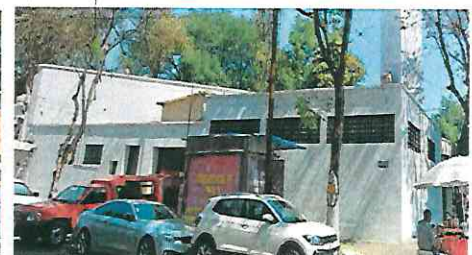
Av. Vicente Suárez