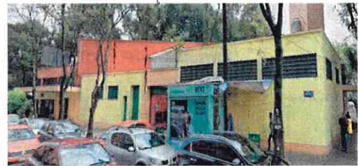
Av. Vicente Suárez

Handwritten signatures and initials in blue and brown ink on the right side of the page.