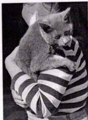
Fotografía. Vista del felino evaluado

En este sentido, de las constancias que obran en el expediente en el que se actúa, se desprende que personal de esta Subprocuraduría realizó el reconocimiento de hechos correspondiente, constatando la existencia de un ejemplar felino macho, con las siguientes características: