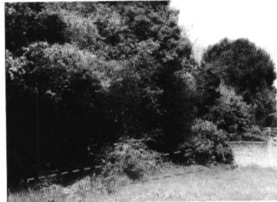
Se muestran las hojas y pastos encontrados en el sitio.

En virtud de lo antes expuesto, esta Entidad considera procedente emitir la presente resolución de conformidad con el artículo 27 fracción VI de la Ley Orgánica de esta Procuraduría, por imposibilidad legal, al no constatar irregularidades en materia de residuos sólidos; toda vez que no se constató la existencia de algún tiradero en el sitio.