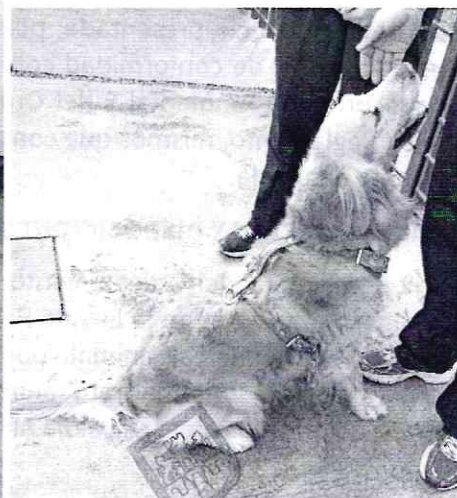
Fotografías.- Vista del ejemplar canino motivo de denuncia y condiciones de alojamiento.