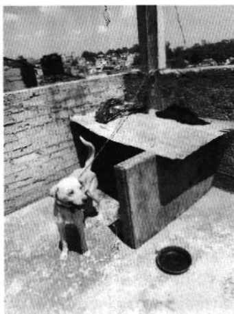
Figura 1. Ejemplar denunciado.

En seguimiento de lo anterior, personal de esta Subprocuraduría llevó a cabo una nueva visita de reconocimiento de hechos con la finalidad de dar seguimiento a las recomendaciones antes mencionadas, constatando que la persona encargada del cuidado del canino llevó a cabo las recomendaciones realizadas por personal de esta Entidad, toda vez que la persona responsable del ejemplar adecuó su sitio de alojamiento, desencadenó a su ejemplar canino, compró bulto de croquetas para aumentar la cantidad de alimento que le proporciona y desparasitó a su ejemplar.