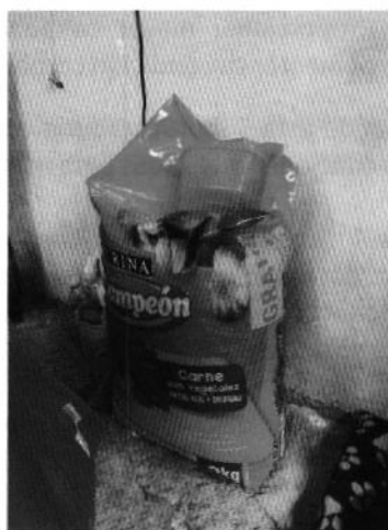
Alimento del ejemplar canino

Medellín 202, piso 4, colonia Roma Sur Alcaldía Cuauhtémoc, C.P. 06000, Ciudad de México Tel. 5265 0780 ext 12011 Y 12400