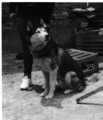
Figura 1. Ejemplar denunciado.