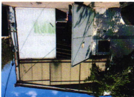
Fotografía 1. Vista exterior del establecimiento motivo de denuncia.

En este sentido, de las constancias que obran en el presente expediente, se desprende que personal de esta Subprocuraduría llevó a cabo tres visitas de reconocimiento de hechos, en días y horarios distintos, de acuerdo a lo establecido en el artículo 15 BIS 4 fracción IV de la Ley Orgánica de esta Entidad, diligencias durante las cuales se constató la presencia de un establecimiento mercantil, por lo cual se notificó el citatorio con número de folio PAOT-05-300/210-2003-2019, a fin de que la persona propietaria, encargada y/o representante legal del establecimiento en cita, se presentara a comparecer en las oficinas que ocupa esta Procuraduría; no obstante, no se obtuvo respuesta.