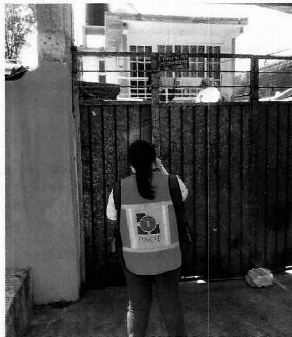
Lugar de los hechos denunciados.

En este sentido, de las constancias que obran en el presente expediente, se desprende que personal de esta Subprocuraduría llevó a cabo dos visitas de reconocimiento de hechos, de acuerdo a lo establecido en el artículo 15 BIS 4 fracción IV de la Ley Orgánica de esta Entidad, diligencia durante la cual una persona habitante del lugar donde se denunciaron los hechos objeto de la presente investigación, hizo de conocimiento al personal adscrito a esta Subprocuraduría que el ejemplar canino que fue señalado en el escrito de la denuncia, ya no se encuentra en el inmueble. Cabe señalar que el personal de la PAOT constató que efectivamente no había algún ejemplar con las características descritas en la denuncia al interior del domicilio en cuestión.