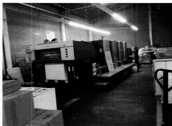
Fotografías 1 y 2. Fachada de la imprenta motivo de denuncia y maquinaria.

Por lo anterior, se realizó una consulta en el Sistema de Información Geográfica de la Secretaría de Desarrollo Urbano y Vivienda de la Ciudad de México (SIG-SEDUVI/CDMX), de la cual se desprendió que conforme al Programa Delegacional de Desarrollo Urbano para la Alcaldía Iztapalapa, al predio en cuestión le aplica una zonificación HC/3/40 (Habitacional con Comercio en Planta Baja, 3 niveles máximos de altura, 40% mínimo de área libre) donde los usos de suelo dentro de la categoría de editoriales, imprentas y composición tipográfica, se encuentran permitidos.