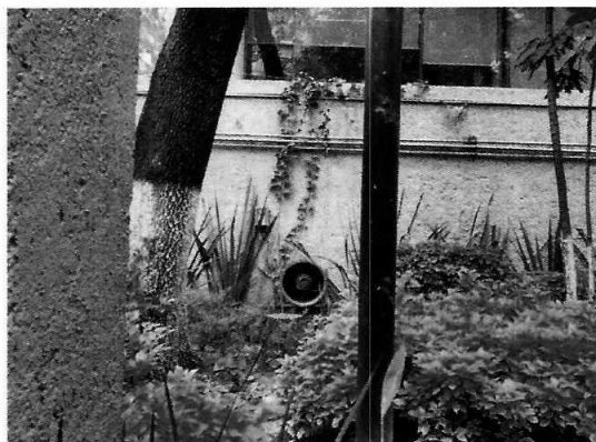
Fotografía 1. Vista del extractor que genera las emisiones motivo de denuncia.

En ese sentido, personal adscrito a esta Entidad, realizó visita al sitio identificado por la persona denunciante como la fuente emisora, diligencia durante la cual se identificó un extractor en la sección del subsótano del edificio, mismo que a decir del personal de mantenimiento, se enciende hasta las 20:00 horas y se tiene programado el mantenimiento de forma periódica. Se les exhortó a mantener niveles de ruido por debajo de la normatividad aplicable.