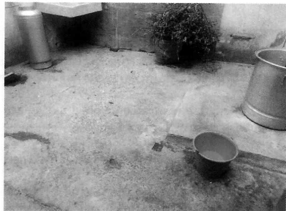
Fotografías 4 y 5. Refugio acondicionado para los caninos y espacio limpio con agua para su libre acceso.

En virtud de lo antes expuesto, esta Entidad considera procedente emitir la presente resolución, de conformidad con el artículo 27 fracción VII de la Ley Orgánica de esta Procuraduría, por el cumplimiento voluntario de las disposiciones jurídicas en materia de bienestar animal.