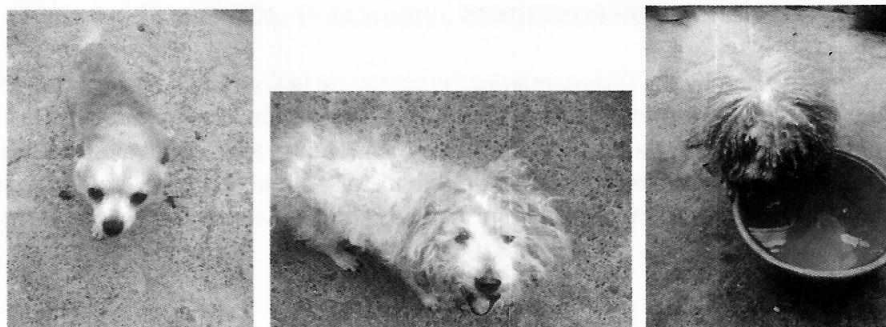
Fotografías 1, 2 y 3. Vista de los ejemplares caninos motivo de denuncia.