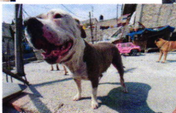
Figuras 1, 2 y 3. Ejemplares denunciados.

Es de resaltar que, en el Acuerdo de Admisión, que fue enviado por correo electrónico a la persona denunciante, se le hizo de conocimiento que contaba con un término de seis días hábiles para aportar las pruebas que estimara pertinentes en la investigación de los hechos, lo anterior conforme al artículo 90 del Reglamento de la Ley Orgánica de la Procuraduría Ambiental y del Ordenamiento Territorial de la Ciudad de