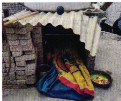
Figuras 3 y 4. Vista del ejemplar canino motivo de denuncia y de su sitio de resguardo.

En virtud de lo antes expuesto, esta Entidad considera procedente emitir la presente resolución, de conformidad con el artículo 27 fracción VII de la Ley Orgánica de esta Procuraduría, por el cumplimiento voluntario de las disposiciones jurídicas en materia de bienestar animal.