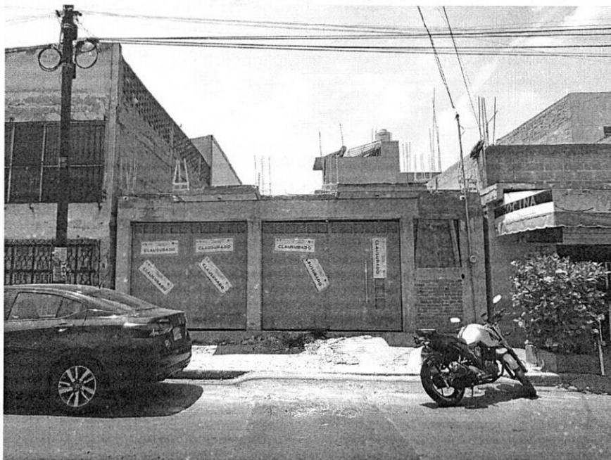
Fuente PAOT: reconocimiento de hechos de fecha 13 de septiembre de 2023.

No obstante, del último reconocimiento de hechos realizado por personal adscrito a esta Entidad, al inmueble objeto de la presente denuncia, se constató la construcción de un inmueble de un nivel de altura en etapa de obra negra, el cual, cuenta con sellos de clausura impuestos por la Alcaldía Iztacalco, de fecha 20 de enero de 2023, sin que se observaran actividades de construcción ni trabajadores. -----