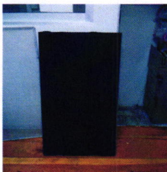
Figura 4. Evidencia enviada por la persona presuntamente responsable de los hechos.

En virtud de lo anterior, la persona presuntamente responsable de los hechos remitió mediante correo electrónico la cotización para la fabricación de una cámara de combustión en una paila para freír churro; así como la fabricación del pasillo y escalera con barandal, de igual manera remitió evidencia fotográfica de los filtros de carbón activado, los cuales serían colocados en el ducto de la campana que desemboca al exterior del establecimiento mercantil en comento.