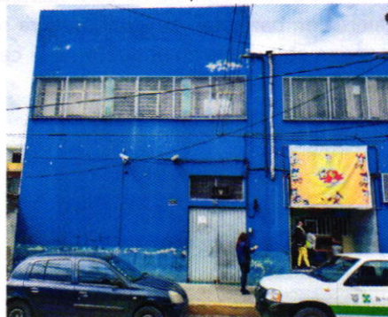
Figura 1. Vista del establecimiento mercantil motivo de denuncia.

En este sentido, de las constancias que obran en el presente expediente, se desprende que personal de esta Procuraduría llevó a cabo una visita de reconocimiento de hechos, de acuerdo a lo establecido en el artículo 15 BIS 4 fracción IV de la Ley Orgánica de esta Entidad, diligencia durante la cual desde el espacio público se constató la existencia del ducto de una chimenea, de la cual no existía emisión de partículas a la atmósfera; no obstante, procedimos a notificar el oficio PAOT-05-300/210-1717-2019.