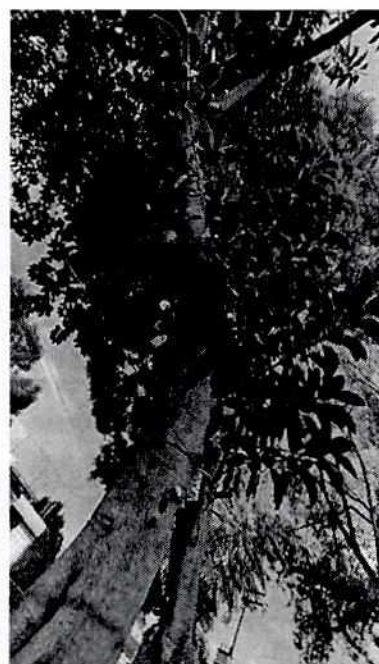
Fotografía 2, Vista del Hule.

Aunado a lo anterior, en relación a los artículos 10 fracción IV y 87 de la Ley Ambiental de Protección a la Tierra en el Distrito Federal, así como por 47 y 52 fracción II de la Ley Orgánica de Alcaldías de la Ciudad de México, esta entidad solicitó a la entonces Dirección General de Servicios Urbanos de la Alcaldía Coyoacán, que indicara al poseedor del multicatado inmueble las acciones a realizar a efecto de retirar el polín y clavos que se encuentran fijados a los troncos de los sujetos arbóreos referidos con antelación; así como realizar las acciones que estimaran pertinentes en relación al sujeto arbóreo que encuentra muerto en pie; lo anterior, en términos de lo señalado por el numeral 7.4.1.1. de la Norma Ambiental para el Distrito Federal NADF-001-RNAT-2015 que a la letra refiere: