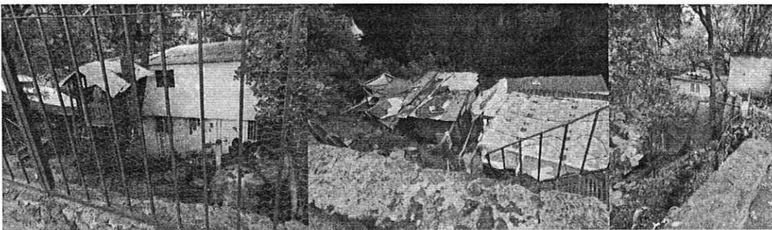
Imagen 1, 2, 3, 4 y 5. Localización y registro fotográfico de visita de reconocimiento de hechos en el predio

Ahora bien, en el caso que nos ocupa, en esta Subprocuraduría se cuenta con antecedente de investigación radicado bajo el expediente PAOT-2016-745-SOT-271, mismo que guarda relación con los hechos denunciados que en el expediente de mérito, derivado del que se emitió Resolución Administrativa de fecha 23 febrero de 2017, en la que se determinó lo siguiente: -----