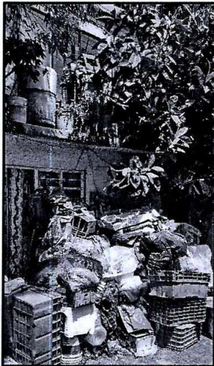
Imagen 1. Fachada del presunto domicilio motivo de denuncia.

En este sentido, personal de esta Subprocuraduría realizó un reconocimiento de hechos de acuerdo a lo establecido en el artículo 15 BIS 4 fracción IV de la Ley Orgánica de esta Entidad, diligencia en la que personal actuante se constituyó en el predio ubicado en calle Pipizahua, número 160, interior 17 segundo piso, colonia Santo Domingo, Alcaldía Coyoacán; sitio en el que se tuvo comunicación con una persona habitante del predio, quien refirió que en ese domicilio no cuentan con interiores ni con perros; cabe mencionar que en el balcón se encontraban macetas con plantas, sin presentar indicios de que se encontrara algún cánido en el lugar.