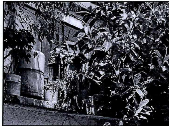
Imagen 2. Balcón del inmueble denunciado donde no se observó ningún animal.

En virtud de lo anterior, se solicitó a la persona denunciante proporcionara información adicional que permitiera a esta Entidad, corroborar los hechos, actos u omisiones que motivaron su denuncia, para lo cual se le concedió un plazo de 5 días; no obstante, no se tuvo respuesta, por lo cual no se tienen elementos que permitan continuar con la investigación.