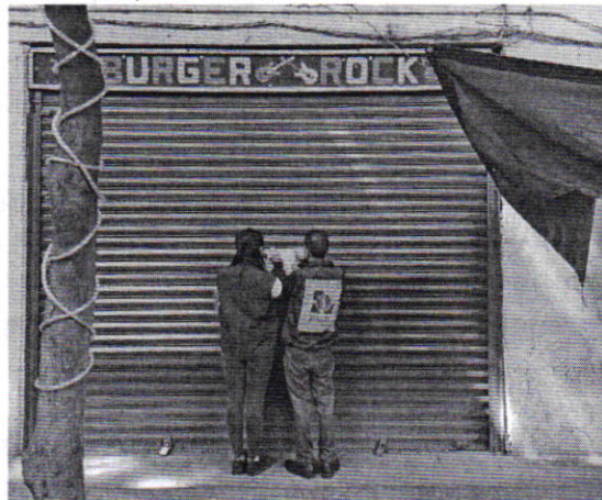
Figura 1. Vista del establecimiento mercantil motivo de denuncia.

En este sentido, de las constancias que obran en el presente expediente, se desprende que personal de esta Procuraduría llevó a cabo una visita de reconocimiento de hechos, de acuerdo a lo establecido en el artículo 15 BIS 4 fracción IV de la Ley Orgánica de esta Entidad, diligencia durante la cual desde el espacio público se observó que el establecimiento mercantil motivo de denuncia no se encontraba en funcionamiento. Por lo antes referido, no se constató la generación de emisiones sonoras por la reproducción de música que fueran susceptibles de medición acústica; no obstante, se fijó en la cortina de acceso a dicho establecimiento mediante instructivo el oficio PAOT-05-300/200-2368-2021.