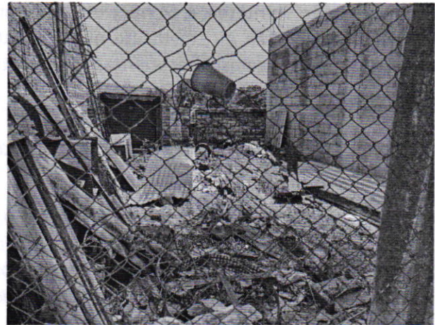
Figuras 1 y 2. Lugar de los hechos denunciados.

En seguimiento de lo anterior, personal de esta Subprocuraduría informó a la persona denunciante que durante visita de reconocimiento de hechos no se constató la presencia de los ejemplares caninos en el sitio señalado en su denuncia, por lo que los hechos que motivaron su denuncia dejaron de existir.