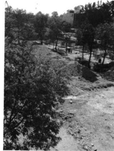
Se muestran los trabajos de la obra y los arboles observados en el sitio.

En este sentido, esta Entidad solicitó a la Dirección General de Construcción de Obras Públicas de la Secretaría de Obras y Servicios de la Ciudad de México, información con respecto a la autorización en materia de impacto ambiental para el proyecto de referencia; autoridad que informó que cuenta con la autorización mediante el formato de Evaluación de Impacto Ambiental derivado de la evaluación del informe preventivo de folio 004276/2020 ingresado en fecha 14 de mayo de 2020, en el cual se establece el derribo de 21 árboles y la afectación de 650.92 m 2 de área verde para la ejecución del proyecto.