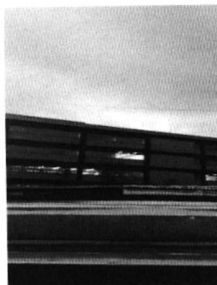
Se muestran la obra terminada en su totalidad.

Por lo descrito anteriormente con la finalidad de asegurar la calidad del ambiente y el bienestar de los habitantes cercanos a la zona del proyecto y toda vez que la obra de referencia se llevó a cabo bajo la evaluación del informe preventivo de folio 004276/2020 ingresado en fecha 14 de mayo de 2020, la Dirección General de Evaluación de Impacto y Regulación Ambiental de la Secretaría del Medio Ambiente de la Ciudad de México, será la autoridad que dará seguimiento a las condicionantes impuestas.