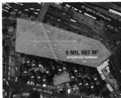
Se muestra la ubicación del proyecto

“Construcción de la Preparatoria Iztapalapa 1 CETRAM”: Consistió en la construcción de un plantel educativo de 8343m 2 de construcción en 4 niveles.