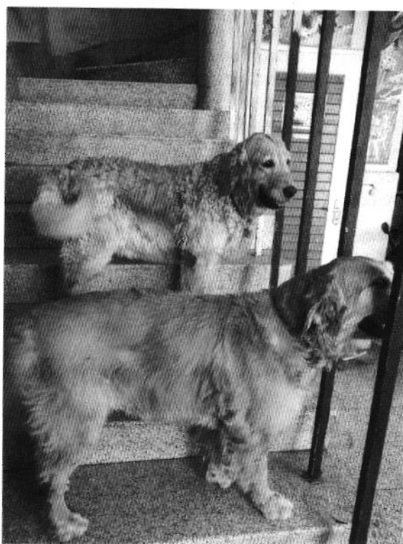
Ejemplares caninos que reponen a los nombres de "Kisha" y "Zvezda".