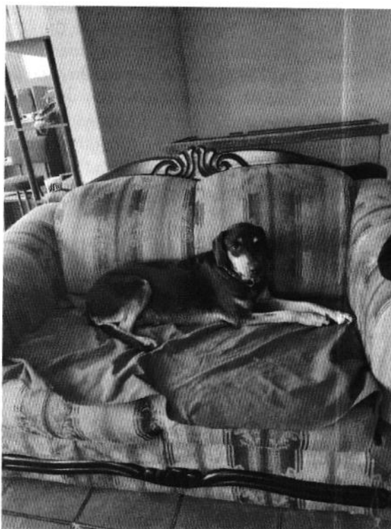
Ejemplar canino que reponde al nombre de "Laika".

Es de resaltar que, en el Acuerdo de Admisión, que fue enviado por correo electrónico a la persona denunciante, se le hizo de conocimiento que contaba con un término de seis días hábiles para aportar las pruebas que estimara pertinentes en la investigación de los hechos, lo anterior conforme al artículo 90 del Reglamento de la Ley Orgánica de la Procuraduría Ambiental y del Ordenamiento Territorial de la Ciudad de México; sin embargo durante el procedimiento de investigación, no fueron proporcionados elementos de prueba que pudieran determinar incumplimiento a la normatividad en materia de bienestar animal.