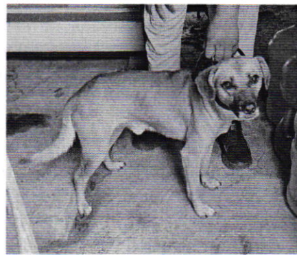
Figuras 1 y 2. Ejemplares caninos denunciados.

Derivado de lo observado y de lo manifestado por la persona visitada, se realizaron las siguientes recomendaciones: