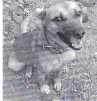
Figuras 7 y 8. Ejemplares caninos denunciados.

En virtud de lo antes expuesto, esta Entidad considera procedente emitir la presente resolución, de conformidad con el artículo 27 fracción VII de la Ley Orgánica de esta Procuraduría, por el cumplimiento voluntario de las disposiciones jurídicas en materia de bienestar animal.