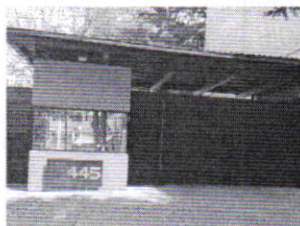
Figura 1. Lugar de los hechos denunciados.

denuncia, ya no se encuentra en el inmueble, lo anterior toda vez que dicho departamento se encuentra deshabitado desde el mes de septiembre de dos mil veintiuno. Cabe señalar que el personal de la PAOT constató que efectivamente no había algún ejemplar con las características descritas en la denuncia al interior del domicilio en cuestión.