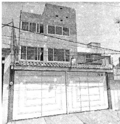
FEBRERO 2020 GOOGLE MAPS