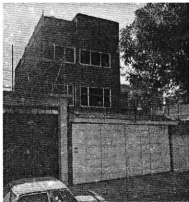
ABRIL 2014 GOOGLE MAPS

México, de aplicación supletoria, a efecto de allegarse y desahogar todo tipo de elementos probatorios para el mejor conocimiento de los hechos sin más limitantes que las señaladas en la Ley de Procedimiento Administrativo del Distrito Federal, siendo que en los procedimientos administrativos se admitirán toda clase de pruebas, excepto la confesional a cargo de la autoridad y las que sean contrarias a la moral, al derecho o las buenas costumbres; en fecha 15 de junio de 2022, realizó la consulta al Sistema de Información Geográfica Google Maps, vía Internet ( https://www.google.com.mx/maps ), y con ayuda de la herramienta Street View, en la cual se localizaron imágenes a pie de calle, con antigüedad de uno a trece años del predio denunciado, se observó que desde el año 2014 se encuentra un inmueble de 4 niveles de altura, mismo que se observó en el reconocimiento de hechos. Acta circunstanciada que tiene el carácter de documental pública y que se valora en términos de los artículos 327 fracción II y 402 del Código de Procedimientos Civiles para la Ciudad de México y 30 BIS de la Ley Orgánica de la Procuraduría Ambiental y del Ordenamiento Territorial de la Ciudad de México. Tal y como se observa en las siguientes imágenes: -----