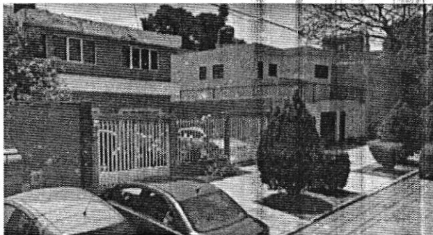
NOVIEMBRE 2014