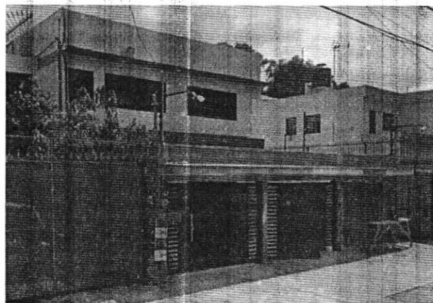
AGOSTO 2022 GOOGLE MAPS

En este sentido, el artículo 55 del Reglamento de Construcciones para la Ciudad de México, establece que para demoler, dismantelar una obra o instalación, se debe obtener la licencia de construcción especial correspondiente. -----