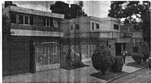
SEPTIEMBRE 2011 GOOGLE EARTH