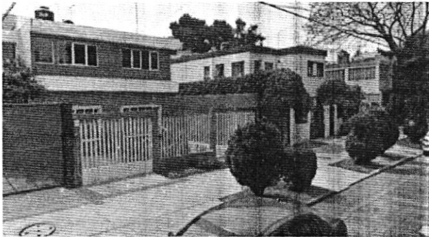
FEBRERO 2009 GOOGLE MAPS