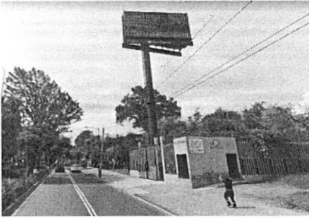
Google Maps Street View – julio de 2021

de agua delimitado por enrejado el cual exhibe los logotipos del Sistema de Aguas de la Ciudad de México y el Gobierno de la Ciudad de México, con la denominación "Pozo Periférico número 6", en su interior se localiza un anuncio bipolar autoportado con publicidad de la empresa publicitaria "Clear Channel" con pantallas led las cuales están en funcionamiento. Posteriormente, en fecha de abril de 2022, se advierte el mismo anuncio autoportado en funcionamiento. Ahora bien, en fecha 25 de agosto de 2022, personal adscrito a esta Subprocuraduría realizó el reconocimiento de hechos al sitio referido, constatando el mismo anuncio autoportado y en funcionamiento. No obstante, en la imagen de octubre de 2022 se constató que el anuncio autoportado antes descrito ha sido retirado del sitio, sin constatar algún anuncio publicitario, tal y como se muestra en las siguientes imágenes: -----