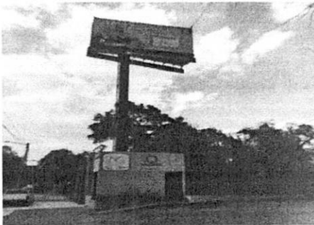
Reconocimiento de hechos de fecha 25 de agosto de 2022