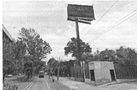
Google Maps Street View – abril de 2022