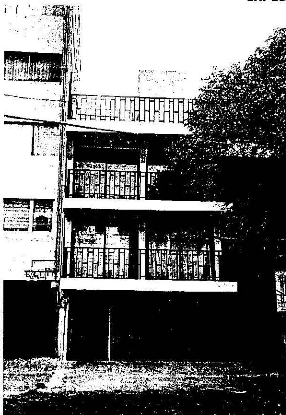
imagen 3. Vista del inmueble denunciado.

De lo anterior se advierte que en el inmueble preexistente de 3 niveles se ejecutaron trabajos de remodelación de la fachada y se llevó a cabo el retiro de los pretilos de la azotea. -----