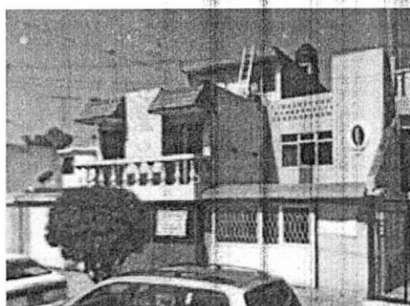
SEPTIEMBRE 2008 GOOGLE MAPS