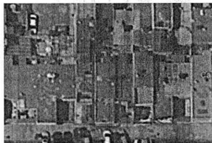
MARZO 2020 GOOGLE EARTH