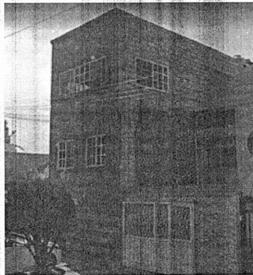
DICIEMBRE 2021 GOOGLE MAPS

Medellín 202, piso 5to, Colonia Roma Norte, Alcaldía Cuauhtémoc, C.P. 06000, Ciudad de México paot.mx T. 5265 0780 ext 13400