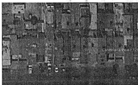
MARZO 2019 GOOGLE EARTH

documental pública y que se valora en términos de los artículos 327 fracción II y 402 del Código de Procedimientos Civiles para la Ciudad de México y 30 BIS de la Ley Orgánica de la Procuraduría Ambiental y del Ordenamiento Territorial de la Ciudad de México. Tal y como se observa en las siguientes imágenes: -----