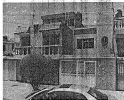
AGOSTO 2019 GOOGLE MAPS