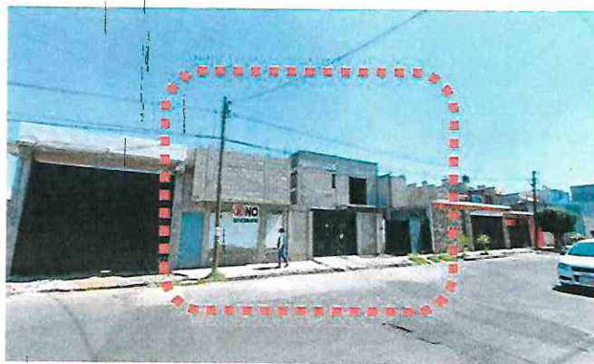
Reconocimiento de hechos de fecha 07 de noviembre de 2022