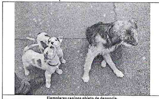
Ejemplares caninos objeto de denuncia.