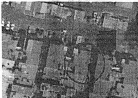
Google Earth Pro, Febrero 2021.

En este sentido, de la información obtenida vía internet y de lo constatado en el reconocimiento de hechos, se advierte lo siguiente: -----