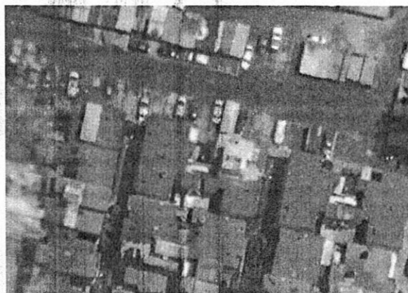
Google Earth Pro, Mayo 2022.