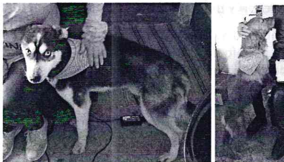
Fotografías.- Vista de los ejemplares caninos que se encontraron en el domicilio.

Medellín 202, piso 4, colonia Roma Alcaldía Cuauhtémoc, C.P. 06700, Ciudad de México Tel. 5265 0780 ext. 12400/12011