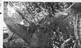
Foto 6. Desmoches y detalle de interferencia de cableado

Imagen del estado fitosanitario del individuo arbóreo Ficus benjamina (laurel).