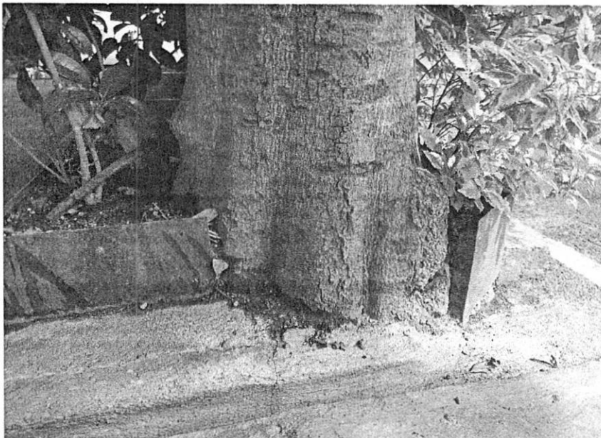
Fotografía tomada por personal adscrito a esta Subprocuraduría en reconocimiento de hechos, 05 de mayo de 2022.

Al respecto, personal adscrito a esta Subprocuraduría llevó a cabo reconocimiento de los hechos investigados, diligencia en la que se constató un inmueble de seis niveles de altura y semisótano, en su frente sobre la banqueta se encuentra una jardinera con varios individuos arbóreos; uno de ellos cuenta con concreto en las raíces. -----