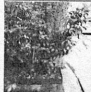
Foto 5. Detalle de base del tronco en primera