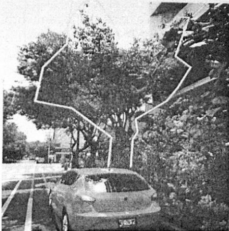
Foto 4. Árbol identificado con número 1, como laurel.