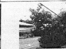
Imagen del estado fitosanitario del individuo arbóreo Bauhinia variegata (pata de vaca).