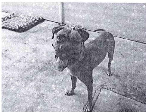
Fotografía.- Ejemplar canino motivo de denuncia.

En este sentido, de las constancias que obran en el expediente en que se actúa, se desprende que, personal adscrito a esta entidad, realizó reconocimiento de hechos, en donde se constató la presencia de 1 ejemplar canino, macho, con características físicas correspondientes a la raza Bóxer, el cual presentó una condición corporal ideal, sin presencia de lesiones, signos de enfermedad o estrés. Dicho ejemplar se encontró atado por medio de una cadena la cual medía aproximadamente 2 metros de largo, contando con un collar lo cual permitía su libre movimiento. El área de alojamiento estaba techada, contando con una cama y recipientes con alimento y agua disponible. Así mismo, se informó que el ejemplar deambulaba libremente la mayor parte del día en la zona de la azotea en donde se percibió que esta contaba con un refugio hecho de cemento así como recipientes con agua y a dicho de su responsable, contaba con su esquema de vacunación y desparasitación actualizados. Por último, se informó que el segundo ejemplar referido en la denuncia, hace meses este fue reubicado, por lo que ya no habita en el inmueble.