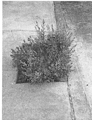
Tocón del árbol actualmente