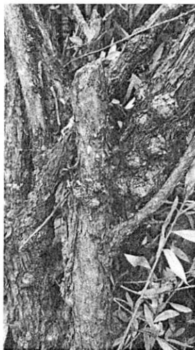
Tronco afectado por el hongo

Ahora bien, se emitió oficio dirigido al Encargado, Propietario u Ocupante del predio objeto de investigación, a efecto de que realizara las manifestaciones que conforme a derecho corresponden. Al respecto, mediante correo electrónico de fecha 29 de septiembre de 2022, recibido en la cuenta institucional ireyes@paot.org.mx , de esta Subprocuraduría, una persona quien omitió ostentarse con alguna calidad, manifestó que el individuo arbóreo de la especie Callistemon, objeto de la presente investigación, presentaba señales de deterioro en su tronco, razón por la cual acudió a un jardinero quien le refirió que un hongo estaba debilitándolo, por lo que la recomendación fue podar el árbol hasta su base y comprar fungicida, al día de hoy dicho individuo arbóreo se encuentra sano y creciendo. Asimismo envió como medios probatorios únicamente fotografías del árbol en comento, sin presentar Visto Bueno, Autorización y/o Dictamen técnico para derribo de arbolado emitido por la Alcaldía Iztapalapa y/o la Secretaría del Medio Ambiente de la Ciudad de México. Ver imágenes siguientes: -----