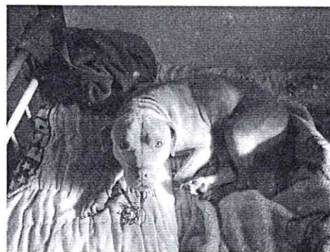
Fotografía.- Ejemplar canino motivo de denuncia.

Posteriormente, a través de medios electrónicos, se recibió evidencia fotográfica en la cual se observa al ejemplar canino motivo de denuncia deambulando libremente dentro del inmueble, en donde cuenta con camas para su descanso.