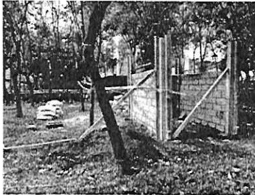
Reconocimiento de Hechos: 21 de junio de 2022

diligencia señaló que las obras las está llevando a cabo la Subdelegación de la Alcaldía para el mejoramiento de la jardinera en cuestión. -----