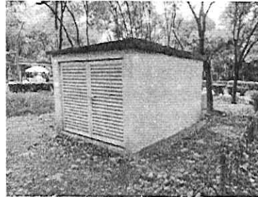
Reconocimiento de Hechos: 25 de agosto de 2022