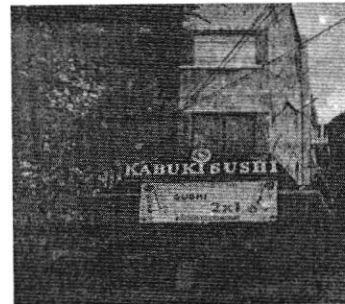
Reconocimiento de hechos de fecha 26 de agosto de 2022.

Cabe señalar que el estudio de los hechos denunciados, y la valoración de las pruebas que existen en el expediente en el que se actúa, se realiza de conformidad con los artículos 21 segundo párrafo y 30 BIS de la Ley Orgánica de la Procuraduría Ambiental y del Ordenamiento Territorial de la Ciudad de México, 85 fracción X y 89 primer párrafo del Reglamento de la Ley Orgánica citada, y 327 fracción II y 403 del Código de Procedimientos Civiles para la Ciudad de México, de aplicación supletoria. -----