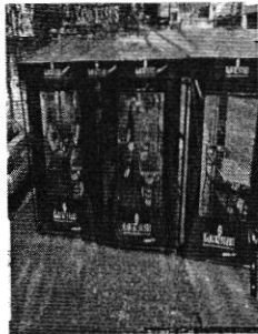
Google maps, Street view: Diciembre 2021