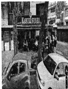
Febrero 2020

de señalar que no se observan elementos fijos a la vía pública como se muestra en las siguientes imágenes. -----