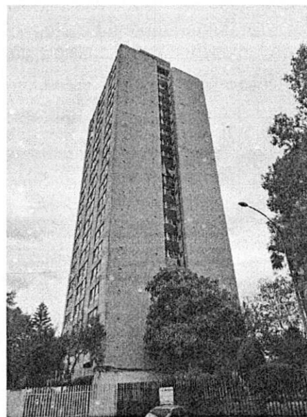
Fuente: PAOT, reconocimientos de hechos realizados por personal adscrito a esta Entidad el 22 de septiembre y 4 de octubre de 2022.