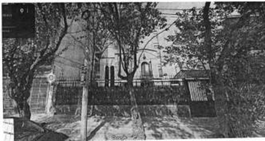
Imagen de fecha enero de 2023