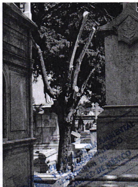
Fotografías 1 y 2. Ejemplo de las afectaciones causadas al arbolado.