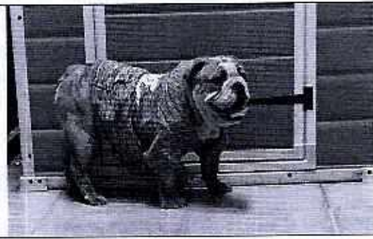
Ejemplar canino objeto de denuncia.

Finalmente, mediante oficio se hizo del conocimiento de la persona responsable del ejemplar canino en comento, la legislación en materia de bienestar animal conminándola a su debido cumplimiento.