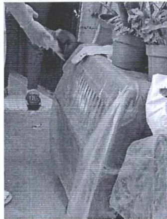
Figura 3. Ejemplar denunciado de nombre Lima.

Es de resaltar que, en el Acuerdo de Admisión, que fue enviado por correo electrónico a la persona denunciante, se le hizo de conocimiento que contaba con un término de seis días hábiles para aportar las pruebas que estimara pertinentes en la investigación de los hechos, lo anterior conforme al artículo 90 del Reglamento de la Ley Orgánica de la Procuraduría Ambiental y del Ordenamiento Territorial de la Ciudad de México; sin embargo durante el procedimiento de investigación, no fueron proporcionados elementos de prueba que pudieran determinar incumplimiento a la normatividad en materia de bienestar animal.