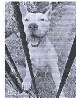
Figura 1 y 2. Ejemplar denunciado.