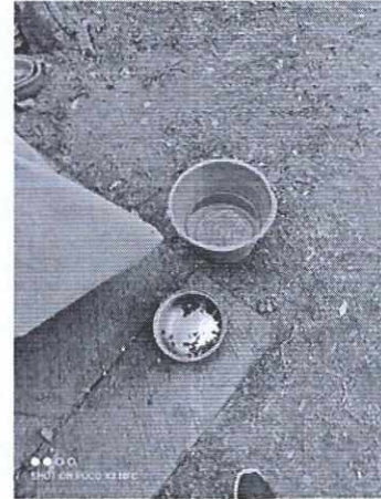
Figuran 3 y 4. Lugar de alojamiento y recipientes para agua y alimento.

Es de resaltar que, en el Acuerdo de Admisión, que fue enviado por correo electrónico a la persona denunciante, se le hizo de conocimiento que contaba con un término de seis días hábiles para aportar las pruebas que estimara pertinentes en la investigación de los hechos, lo anterior conforme al artículo 90 del Reglamento de la Ley Orgánica de la Procuraduría Ambiental y del Ordenamiento Territorial de la Ciudad de México; sin embargo durante el procedimiento de investigación, no fueron proporcionados elementos de prueba que pudieran determinar incumplimiento a la normatividad en materia de bienestar animal.