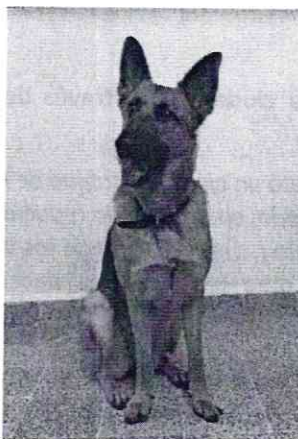
Fotografía.- Ejemplar canino motivo de la denuncia.

Por lo anterior, personal de esta Procuraduría proporcionó información de servicios médicos veterinarios especialistas en conducta animal para brindarle al canino consulta etológica. Asimismo, se brindó información y ejercicios para trabajar en casa el Síndrome de Ansiedad por Separación, señalando que dichos ejercicios no sustituyen la atención especializada de un Etólogo Clínico.