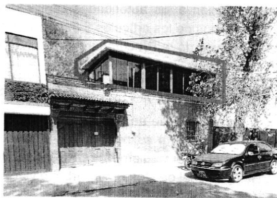
Fotografía: Reconocimiento de hechos 29 de enero 2020

En ese sentido, a solicitud de esta Subprocuraduría, la Dirección General de Obras y Desarrollo Urbano de la Alcaldía Coyoacán, informó que no cuenta con Registro de Manifestación de Construcción. -----