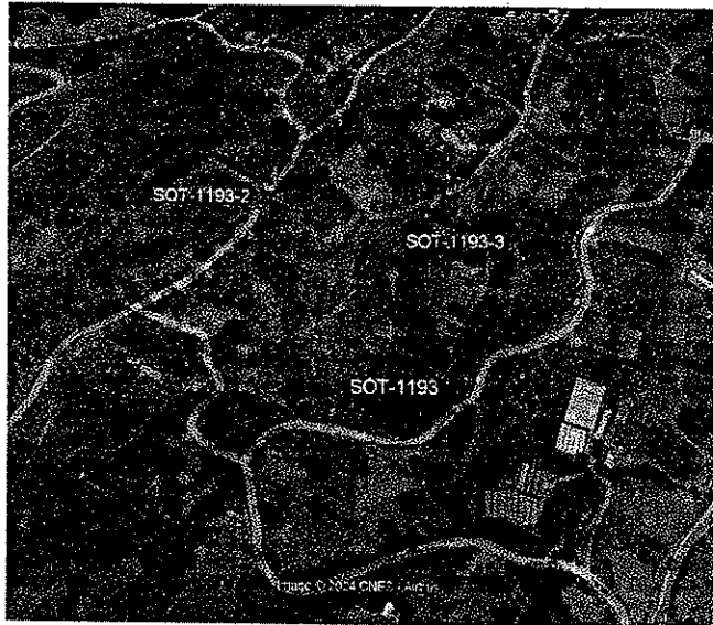
Imagen aérea de enero de 2022